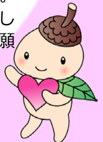
世田谷区社協キャラクター ココロ

費用のご負担は一切ありません。 自販機の設置場所の提供を通して、地域福祉の推進にご協力をお願いします。