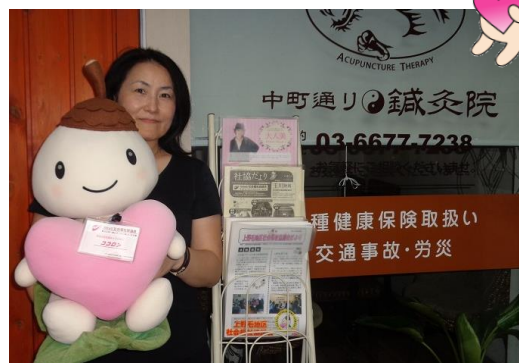
〈中町通り鍼灸院 様〉