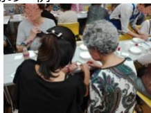
高齢者向けの交流イベントで一緒に手芸