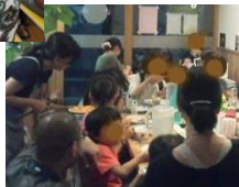
子ども食堂で調理などのお手伝い