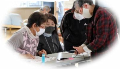
やわらぎマッサージ