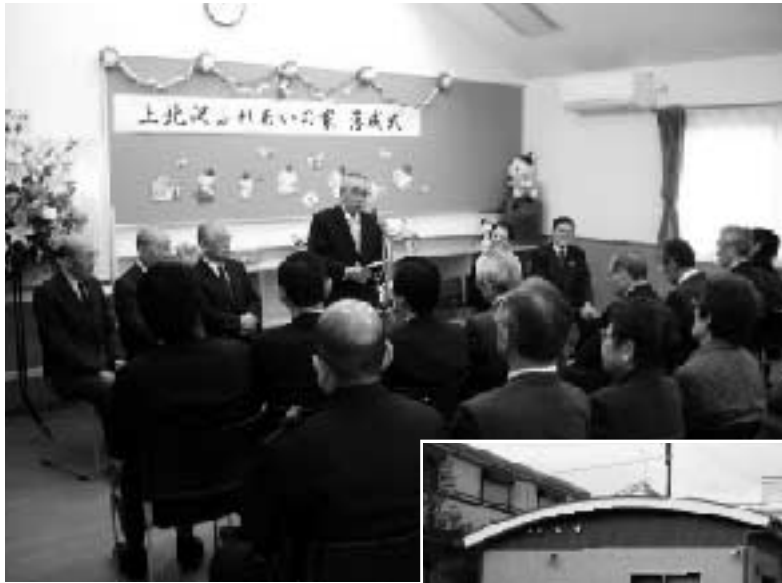
●祝辞を述べる倉本会長